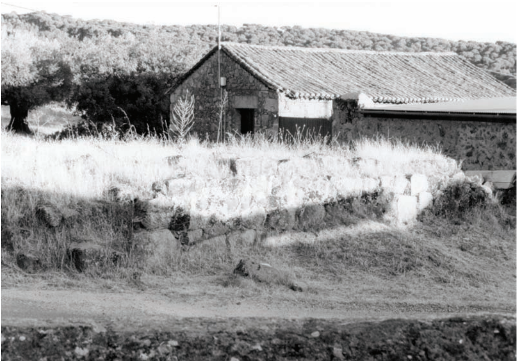
Ermita de la Sangre por su parte oeste, la mejor conservada.

Si hasta aquí, con carácter definitivo no sabemos nada, de aquí en adelante, hasta 1864, sólo tenemos algunas referencias, a veces indirectas o sólo relacionadas con la Cofradía de la Sangre y no con la Ermita, en los libros de la Iglesia de La Adrada, conservados en el Archivo Diocesano de Ávila, Estante nº 132/2/2.