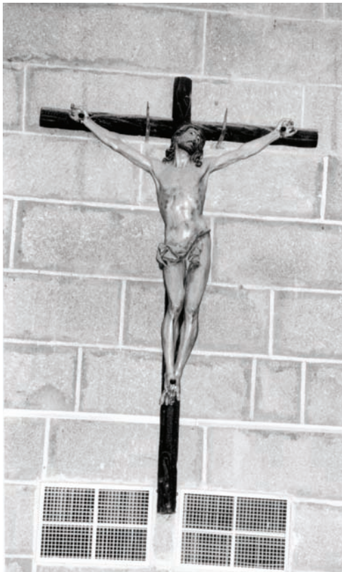
Cristo de la Sangre.

exista en La Adrada. "(Queremos suponer que se refiera a la tabla).