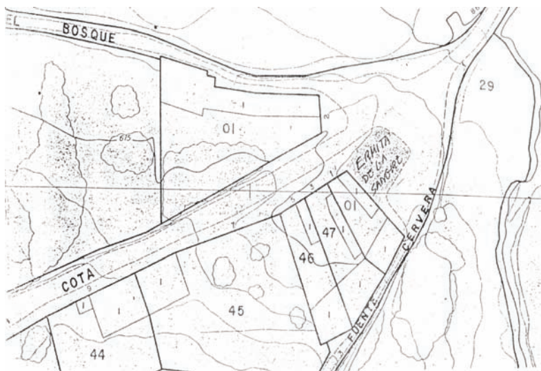
Plano del catastro de La Adrada, donde se encuentra la Ermita de la Sangre.

Adrada, saliendo por la calle Larga hacia la Cota, “según aparece en los documentos de este municipio, como un ensanche del camino en la confluencia de tres de ellos, no formando finca o parcela, tal como se justifica mediante fotocopia del plano catastral de la zona de su ubicación”; 12 según las Estampas viejas, de las que hablaremos más adelante, “extramuros de la Villa que se hace a la olivilla”