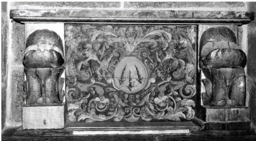
Tabla de la Ermita de la Sangre, junto a Baptisterio de la Iglesia del Salvador

Desde la Asociación Tietar: Valle y Montaña (Asociación de Amigos de La Adrada) nos conformaríamos con el hecho de que las ruinas de lo que fue la Ermita de la Sangre, probablemente con más de 500 años, con una tradición enraizada en la religiosidad del siglo XV,