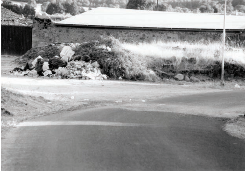
Ermita de la Sangre en septiembre de 2001

por la segunda, en la que se exagera encomiásticamente las virtudes del rey... se le concede la mitad de la décima y las dos tercera partes de la cruzada?