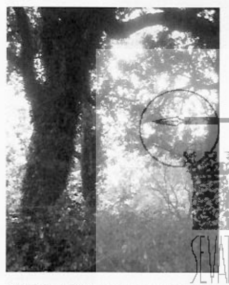
Alcornoques formando setos separadores de fincas

terísticas interesantes: nuestra especie arbórea Quercus suber vuelve a ser casi exclusiva, el elemento lianoide mengua, pero no desaparece, pues las hiedras (Hedera hélix) sustituyen a las parras. El estrato arbustivo se compone de durillos (Viburnum tinum), sin presentar un carácter cuasi selvático como el anterior, es un tipo de formación extraordinaria, llamativa, constituyendo el retazo de lo que serían la mayoría de las tierras del cultivo hoy, si la mano del hombre no hubiese pasado por ellas.