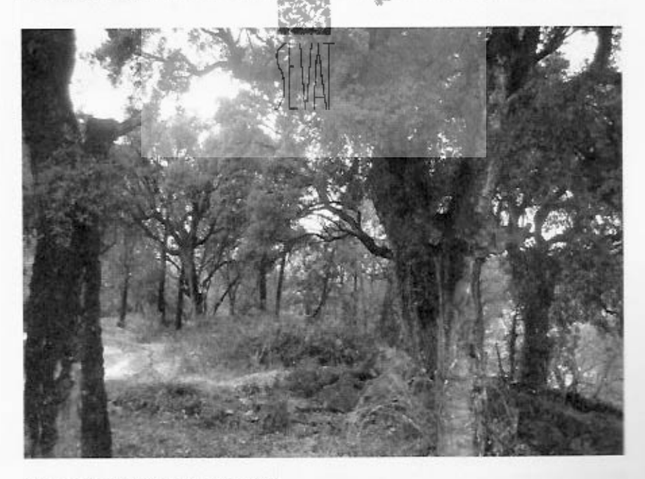
Alcornocal con bajo nivel de humedad

Todas estas características se dan en nuestro valle, lugar de suelos ácidos, con un tipo de clima mediterraneo subhúmedo de precipitaciones eleva-