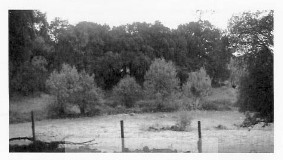
Bosque de alcornoques asociados a pinos y otras especies

y llanas, debido a la mayor capacidad del suelo para retener la precipitación (es curiosa, en cambio, la asociación pino albar-encina en la parte oriental del valle, donde llegan a formar bosqués estratificados ocupando las copas de los pinos el horizonte superior (10-15 m) y las encinas el inferior (esto se puede comprobar en el cerro Pinosa en Sotillo) y nos asombra la casi nula coexistencia entre robles y encinas