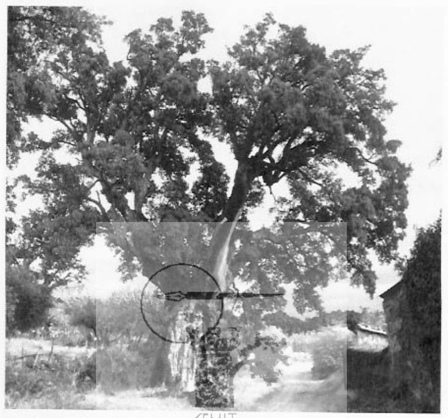
Magnifico y antiguo ejemplar de alcorhoque el Pontón de la Bujera. Piedralaves

Apenas hay regeneración entre ellos puesto que son viejos para producir bellota de calidad y la mano humana ha impedido la recuperación de la especie.