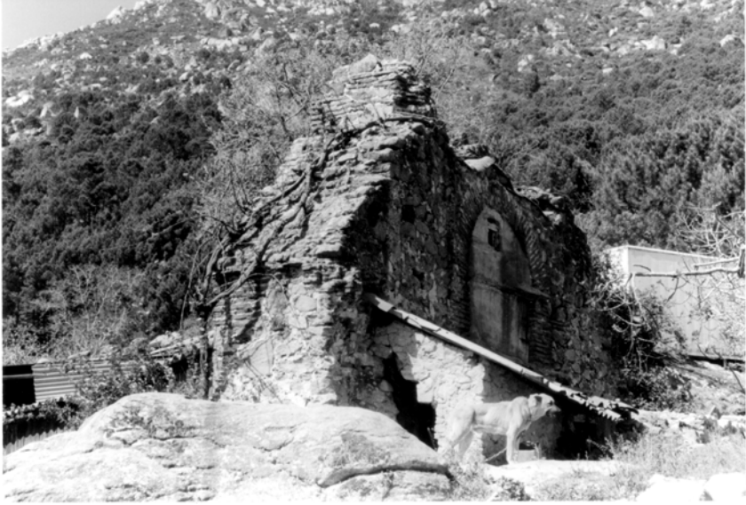
Restos de la ermita de San Juan