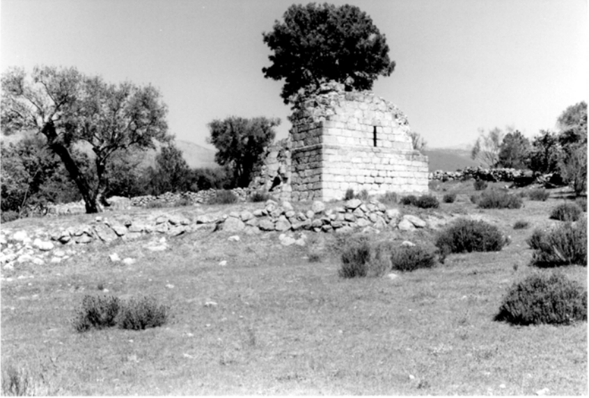
Restos de la iglesia del despoblado de Las Torres

tura de la casa de la Iglesia". No queda claro si los despojos y piedra son para la casa de la iglesia, pero lo cierto es que la ermita de San Blas fue demolida y su imagen trasladada a la iglesia. De hecho, ninguna de las personas a las que hemos preguntado tiene constancia de la existencia de la ermita de San Blas.