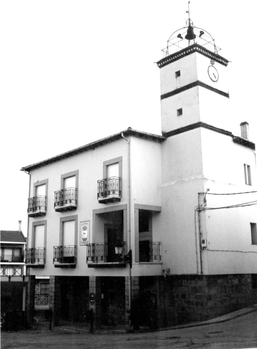
Ayuntamiento de Lanzahita